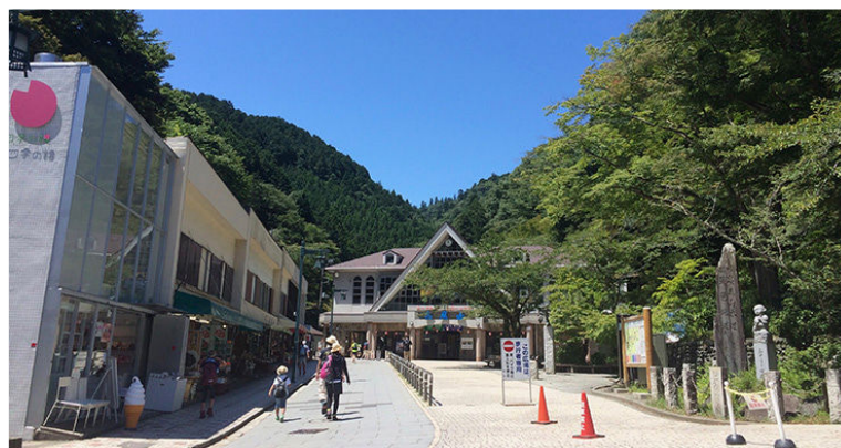
高尾山登山の入り口にある清滝駅:京王高尾山口駅から徒歩5分。 ※ケーブルカー、リフトは使いません!